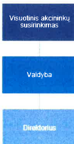
1 pav. Bendrovės valdymo struktūra.